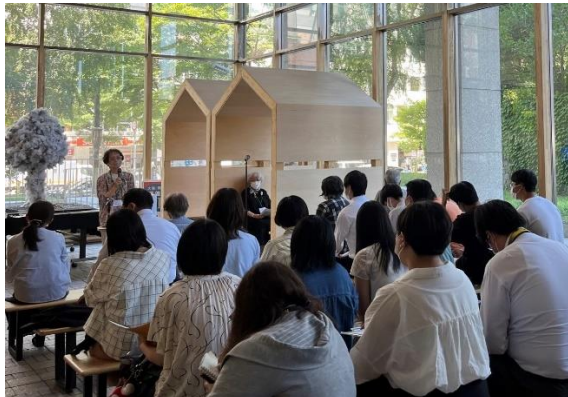
昨年の「被爆の証言と原爆展」。多くの学生も参加。